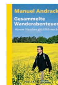
Taschenbuch € 14,99 978-3-492-40532-4

Manuel Andrack , 1965 in Köln geboren, wurde u. a. durch seine Zusammenarbeit mit Harald Schmidt bekannt. Seit 2004 engagiert er sich für das Wandern. Er ist Autor und Moderator beim Saarländischen Rundfunk, hat zahlreiche Bücher verfasst und schreibt regelmäßig für den Stern, DIE ZEIT, GEO Special u. a. Er lebt mit seiner Familie im Saarland. Bei Malik NG liegt sein Band »Gesammelte Wanderabenteuer« vor. www.manuel-andrack.de